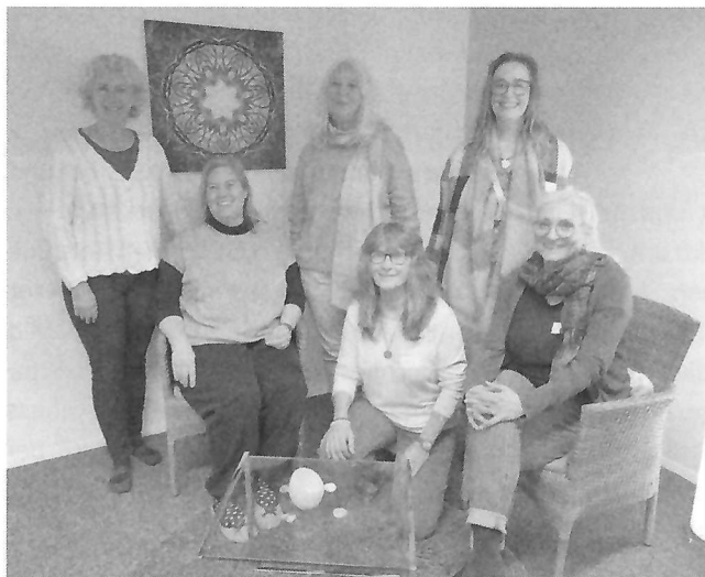
Altes und neues Kern-Team – Veranstalterinnen des Jubiläumstages

Am 16. November 2024 feierte das Gründungsteam mit ihren Untermieterinnen das einjährige Bestehen des Gemeinschaftsraums «Leuchtturm Pilgerstrasse 1» und zeigte mit einem abwechslungsreichen Programm einen Einblick in seine Wirkungsfelder und die zahlreichen Gäste erfuhren, dass sich das Kern-Team auf 2025 neu zusammensetzen wird.